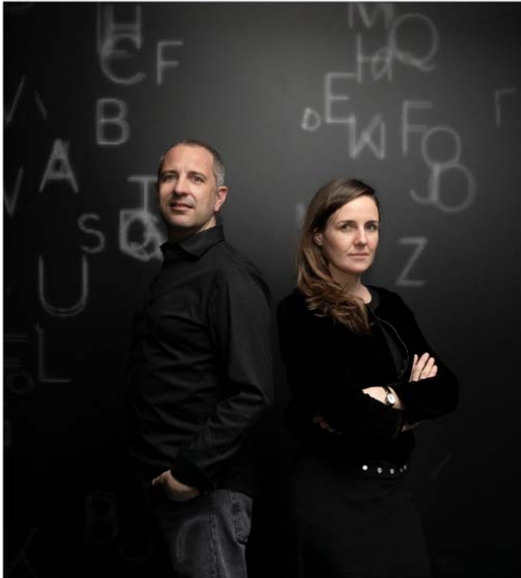
Janvier 2020 à la Gaîté Lyrique.

A día de hoy, la compañía cuenta con 30 colaboradores, con dos exposiciones y tres espectáculos en gira internacional. Su sede social y sus oficinas de producción se encuentran ubicadas en Lyon y a Crest (Drôme). La compañía tiene el apoyo de la DRAC Auvergne-Rhône-Alpes, de la Région Auvergne-Rhône-Alpes y está subvencionada por la ciudad de Lyon.